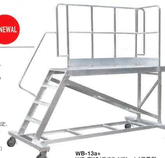
WB-13a+ WB-TKS(手すりオプション)装着例

連結方法 蝶ボルトで固定、 連結したまま 移動が可能。 (本体への 穴あけ加工なし)